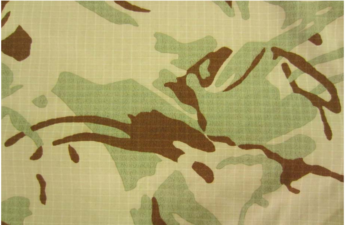
Слика 1 – Начелни изглед пустињског дезена